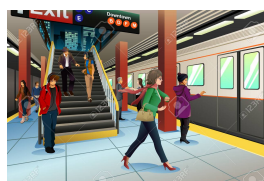
jag åker tunnelbana