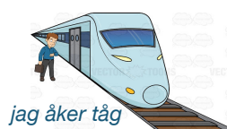
jag åker tåg