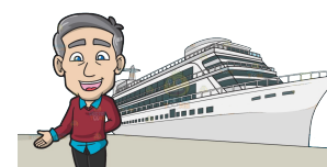
jag åker båt