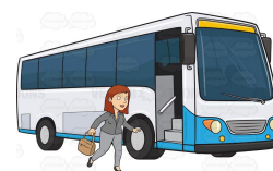
jag åker buss