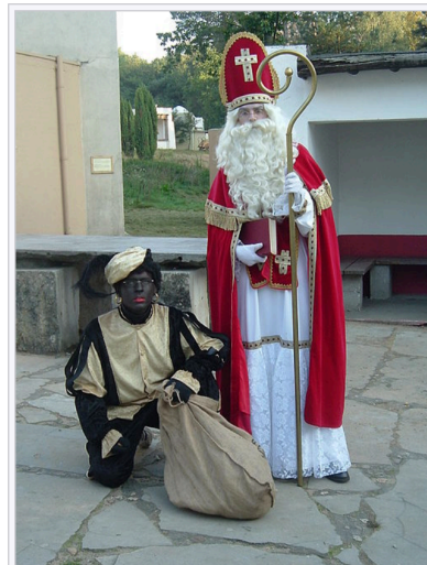
Zwarte Piet, till vänster, tillsammans med Sankt Nikolaus.

Zwarte Piet ( info ) ("Svarte Petter"), är en folkloristisk figur i Belgien och Nederländerna, som utgörs av en mörkhyad betjänt som arbetar för Sankt Nikolaus ( Sinterklaas på nederländska). Den årliga Sinterklaas -festen infaller den 5 december i Nederländerna, och 6 december i Belgien, då detta par delar ut godis och presenter till snälla barn.