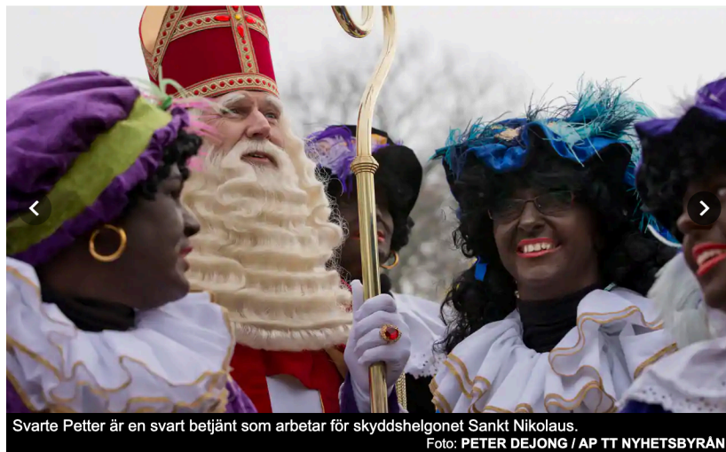
Svarte Petter är en svart betjänt som arbetar för skyddshelgonet Sankt Nikolaus.

NEDERLÄNDERNA Publicerad 17 nov 2019 kl 08.17